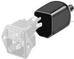
Diverse_Abdeckung Rückseitige Schutzabdeckung