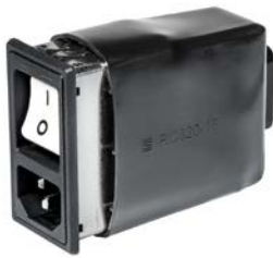
RC320 Rückseitige Abdeckung für Gerätestecker