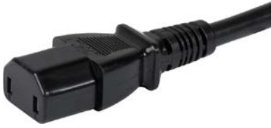
IEC Gerätesteckdose C17 schwarz

US Anschlussleitung mit IEC Gerätesteckdose C17, gerade