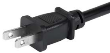
Netzstecker Nordamerika schwarz